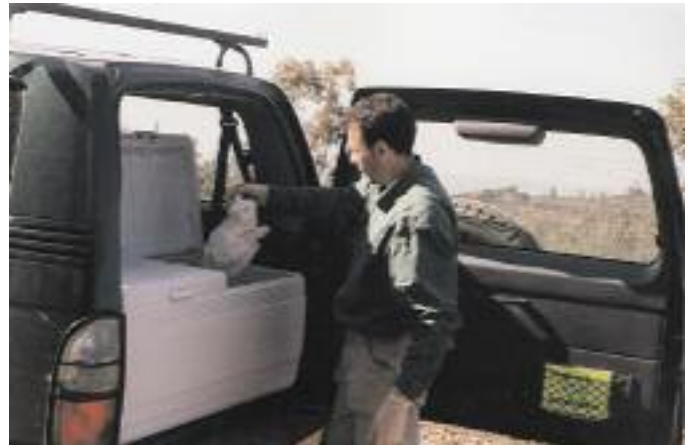
La carroña es transportada hasta los comederos donde se pone a disposición de los buitres.

Además, siguiendo los objetivos del Proyecto, con nuestra presencia en la Sierra de la Contienda hemos comprobado que no existen parejas nidificantes en el área de trabajo. No hemos encontrado, asimismo, acciones humanas susceptibles de perjudicar la recuperación de la colonia o de dañar a algún individuo (trabajos forestales, caza, venenos, etc.). Hallamos, durante el desarrollo de nuestros trabajos, el cadáver de un Buitre negro que, tras ser analizada por técnicos de la Consejería de Medio Ambiente, determinaron que, si bien había muerto por ahogamiento, sus problemas hepáticos le habrían producido la muerte en breve.