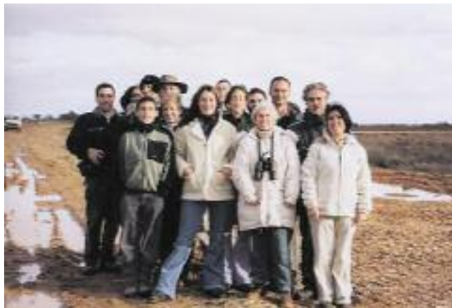
Grupo de viajeros bien pertrechados para soportar las bajas temperaturas características de esta comarca extremeña.

Al día siguiente, por la mañana muy temprano, fuimos por la curiosa zona geológica, llamada "Dientes de Perro" allí tuvimos la ocasión de ver abundantes mochuelos y ratoneros; a la tarde fuimos por el pantano en donde vimos los bellos y atareados Somormujos