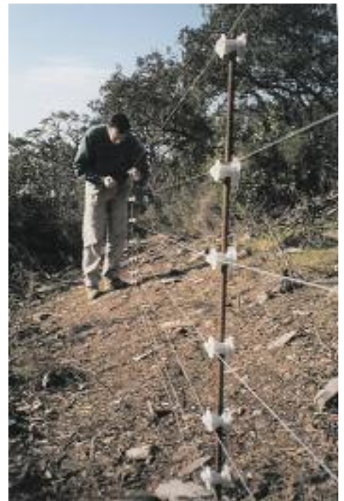
Instalación del pastor eléctrico para proteger el aporte de carroña a los Buitres negros.

Durante el tiempo dedicado al montaje de la valla electrificada, hemos suspendido el aporte de carroña en Puerto Moral, continuándolo en La Contienda. Paralelamente a esta actividad habíamos encargado a un profesional la elaboración de un modelo a tamaño natural de Buitre negro. Nuestra intención es colocarlo en posaderos cercanos a los nidos artificiales, con el fin de atraer a alguna pareja hacia esos lugares y que opten por anidar. Sin embargo, su primer emplazamiento será el comedero de la Reserva Biológica Puerto Moral, donde esperamos que cumpla la función de reclamo, aunque esta vez para que acudan a alimentarse, ya que hemos creído necesario atraer cuanto antes a