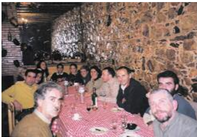
Tras la intensa jornada ornitológica se disfrutó de la gastronomía típica de la zona.

En los fríos días del noviembre extremeño se realizó el viaje a La Serena 2002. Allí acudimos unos cuantos esperanzados participantes. En nuestro primer días de observaciones pudimos disfrutar de la contemplación del ave por la cual nos congregamos allí, La Avutarda. Un abundante grupo, se exhibió ante nosotros, prácticamente recién llegados al páramo. Allí también contemplamos patos y algunos ánsares, pero el Sisón, ave esteparia también por excelencia, sólo se pudo adivinar por un sobresaliente cuello.